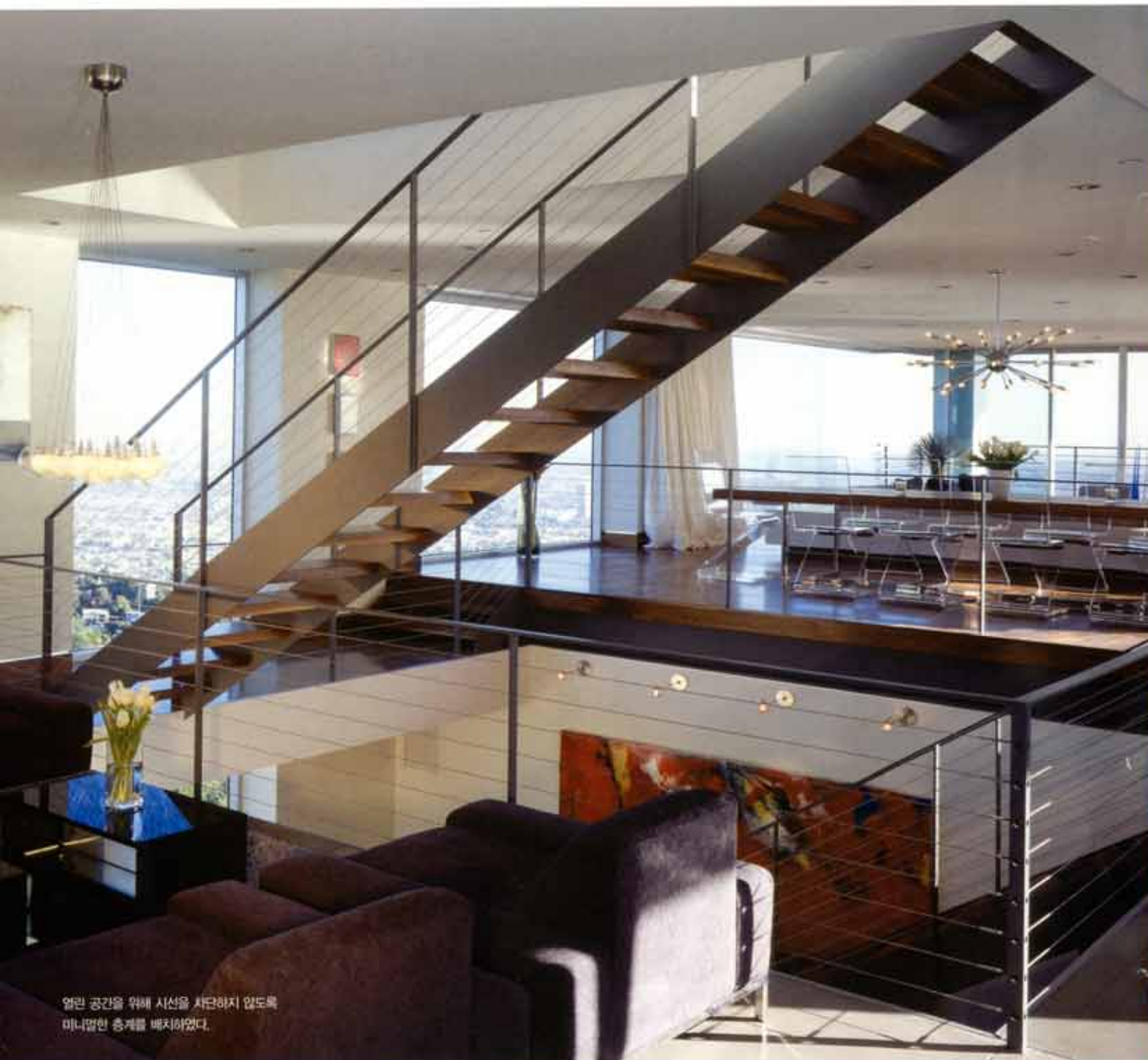
열린 공간을 위해 시선을 차단하지 않도록 미니멀한 층계를 배치하였다.

이 주택은 거실과 침실, 서재 등 주거공간이 갖추어야 할 기본적인 요소들 외에도 거주자가 누리게 될 Hollywood에서의 화려한 생활을 수용해 줄 수 있는 공간들이 배치되어 있다. 이들 공간은 한면은 지상, 다른면은 지하인 1, 2층 공간에 주로 분포되어 있는데, 조용히 영화를 즐길 수 있는 개인 영화관과 신체 단련을 위한 체육관, 서재, 각종 행사와 파티가 있을 시에 사용될 요리사를 위한 보조 주방이 설치되어 있다. 또한 와인바에는 바텐더를 위한 공간이, 댄스 파티를 위한 공간에는 DJ 부스가 따로 준비되어 그 규모와 전문성을 가능하게 해준다. 이들 공간 위로는 거실이 있는데, 대부분의 벽면이 유리로 마감되어 어느 곳에서든 탁 트인 시야로 LA의 전경을 느낄 수 있도록 설계되었다. 커다란 식탁과 테이블은 많은 사람들이 방문할 시에도 넉넉하도록 준비되어 있는데, 이것 외에도 방문객을 위한 게스트룸이 따로 준비되어 있어 손님을 맞을 준비를 갖추고 있다. 이 공간의 가장 특징적이면서도 중요한 부분인 거주자 침실은 4층에 넓게 위치하고 있으며 기본적인 공간 외에 돌출되어 있는 부분을 따로 두어 공간을 더욱 넓게 사용할 수 있도록 하였다. 의자와 테이블이 놓인 이 부분은 3면이 유리로 제작되어 시야를 넓혀주고, 외부의 햇빛을 내부에서 충분히 느낄 수 있도록 해준다.