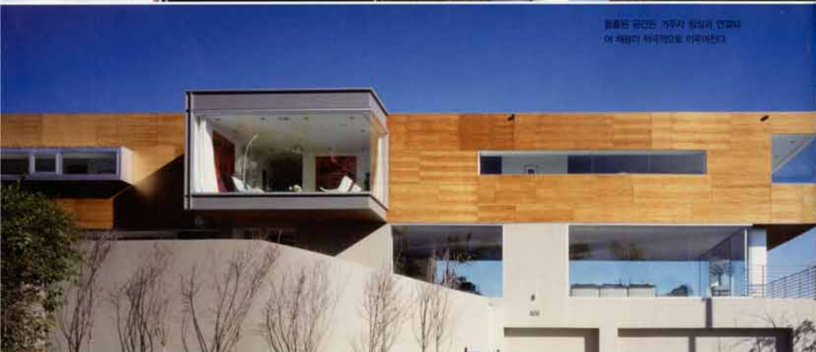
활용된 공간은 거주자 합실과 연결되어 채광이 탁월적으로 이루어진다.