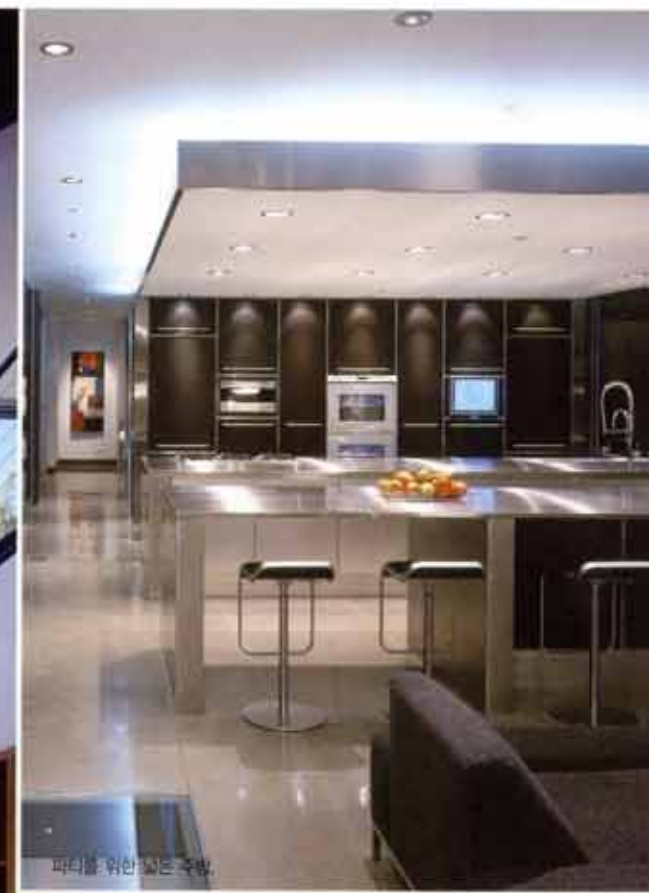
파티를 위한 빛의 공간.