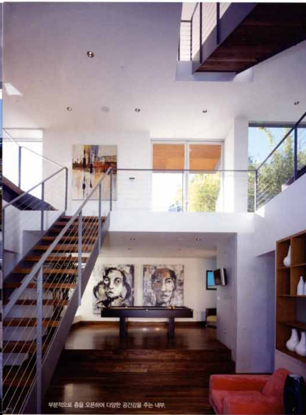
부분적으로 층을 오픈하여 다양한 공간감을 주는 내부.