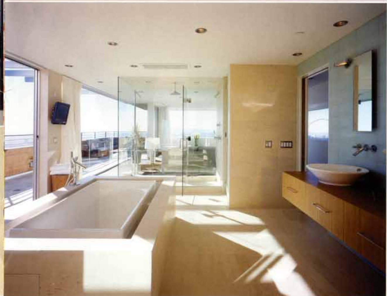
◀ 높은 지대의 특성을 반영하여 전면창으로 제작한 미니멀 디자인의 욕실.