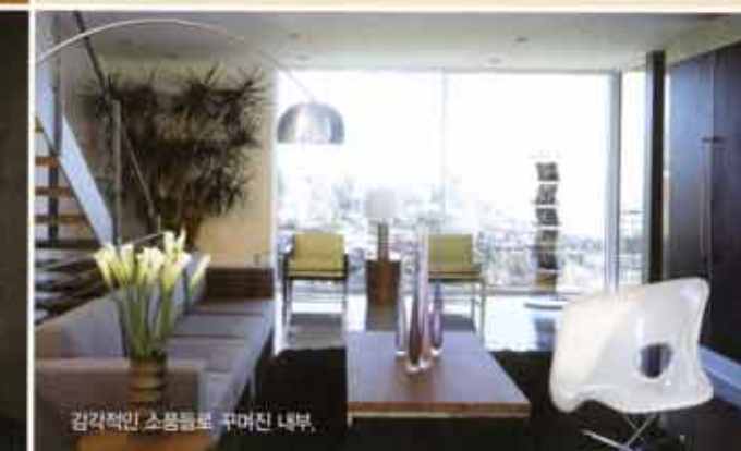
감각적인 소품들로 꾸며진 내부.