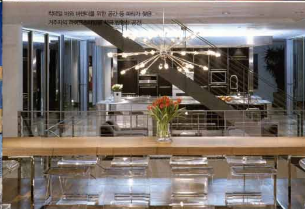
각대일 바의 배너를 위한 공간 등 파티가 잦은 거주자의 라이프스타일을 적극 반영한 공간.

도시전체가 한눈에 들어다보이는 곳에서 어스름해질 무렵의 전경을 즐기는 것, 혹은 가까운 친구들과 모여 와인 한잔과 즐거운 시간을 즐기는 것. 이는 동서고금을 막론하고 대다수의 사람들이 바라는 이상적인 집의 형태인 듯하다. 미국 Los Angeles의 전경이 한 폭의 그림처럼 펼쳐져 보이는 언덕에 자리 잡은 House on Blue Jay Way는 이러한 소망을 가득 담고 있는 꿈같은 주거공간이다.