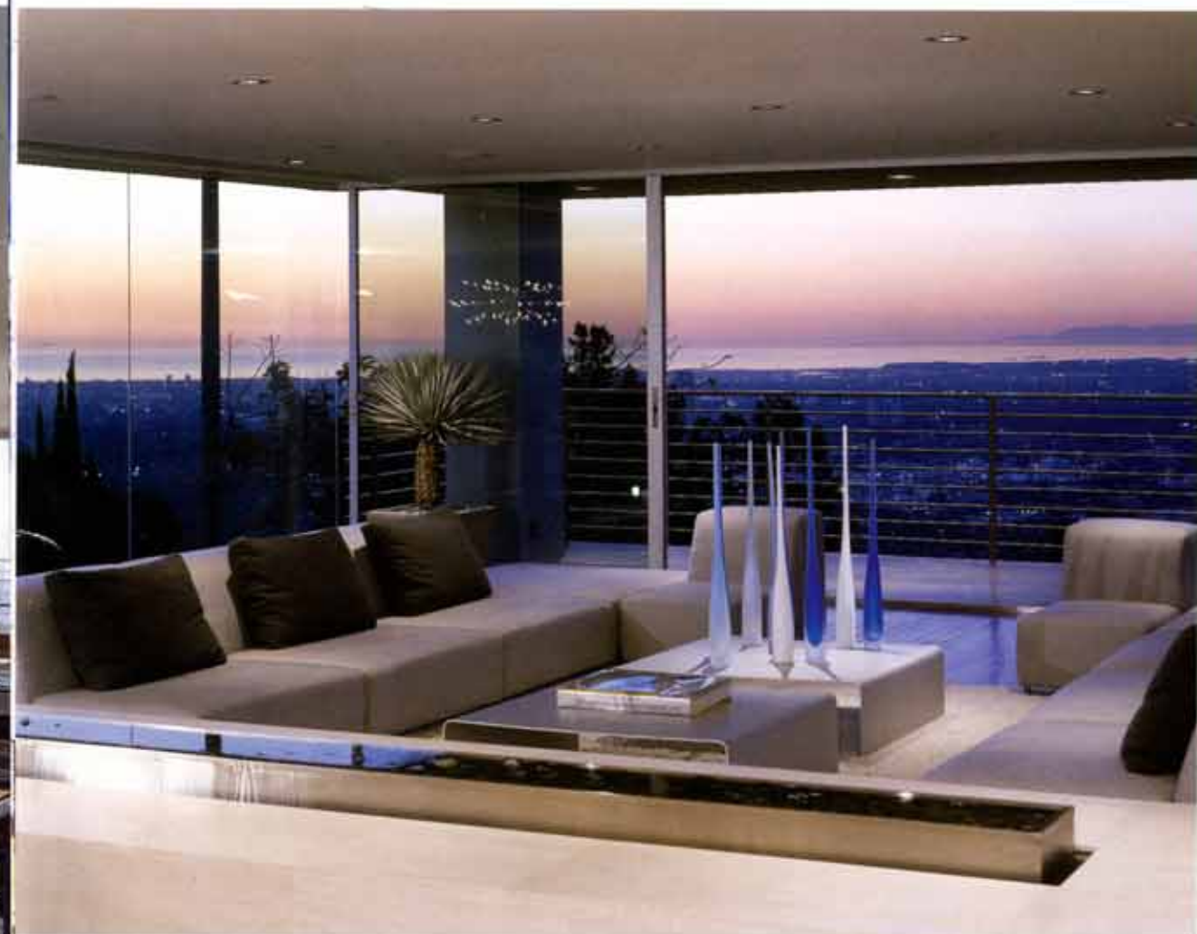
◀ 넓은 거실은 전면창으로 설계되어 더욱 넓어보인다.

즐겁고 화려한 이 주거공간을 통해 건축가가 의도한 것은 '열린 건축'이었다. 이에 따라 건물 내의 어떤 요소도 서로의 시야를 가리지 않도록 설계되었으며 외부의 햇빛과 아름다운 경관을 내부로 유입할 수 있도록 하여 지형이 가진 단점을 장점으로 승화시켰다. 건축가의 의도와 클라이언트의 요구가 적절히 조화된 본 프로젝트로 건축가는 2005년 미국건축가협회 캘리포니아지부(AIACC)에서 Honor Award를 수상하였다.