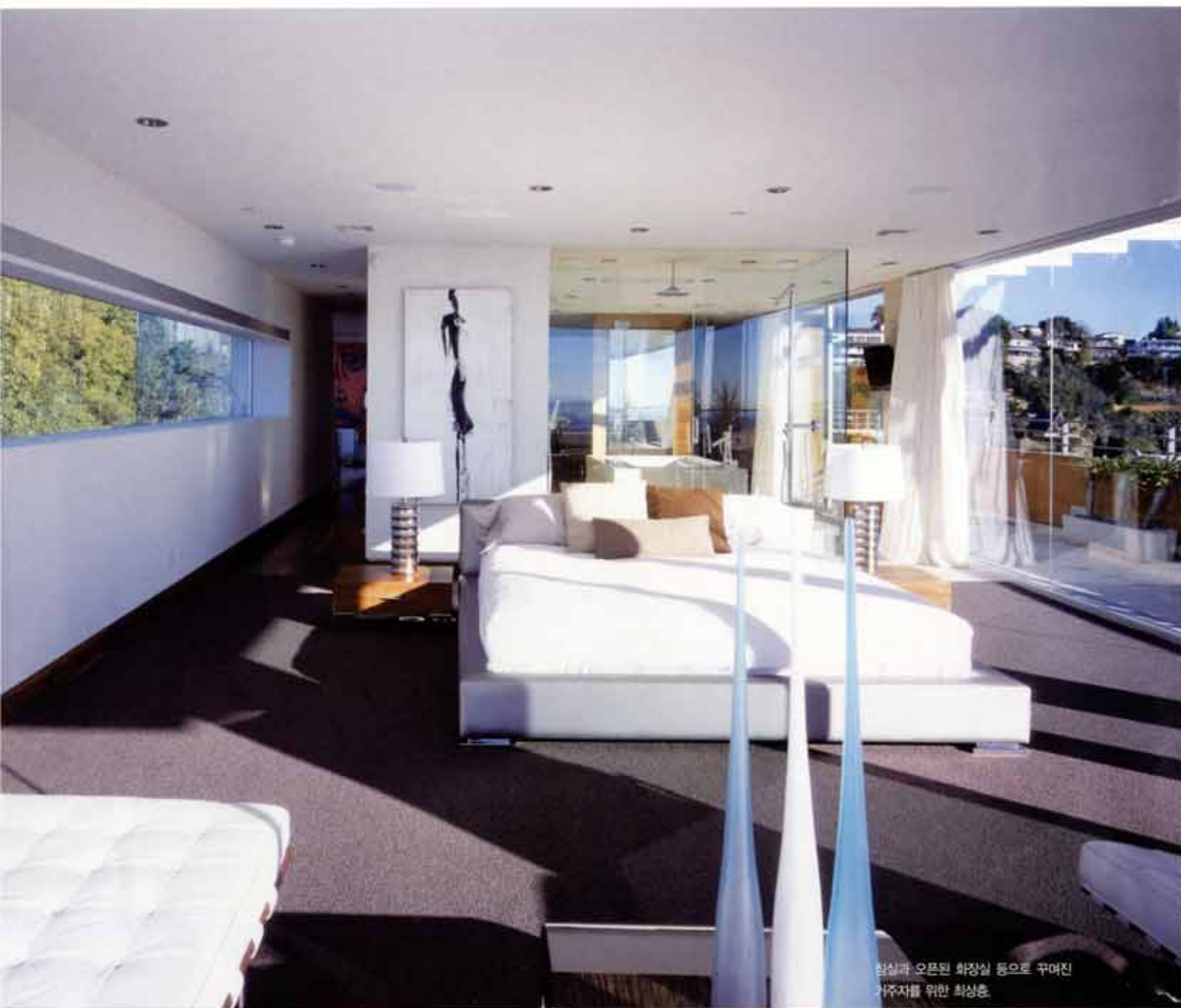
합실과 오픈된 화장실 등으로 꾸며진 거주자를 위한 최상층.