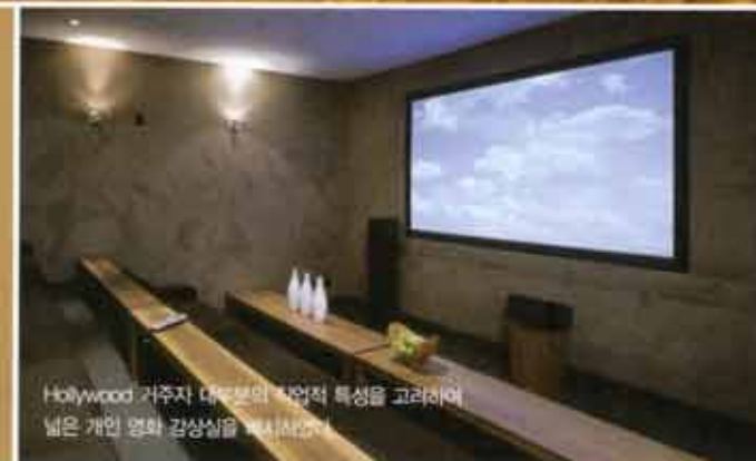
Hollywood 거주지 대부분의 1인적 특성을 고려하여 넓은 개인 영화 감상실을 배치함

This project is basically a renewal of the house built on Blue Jay Way at the steep slope of 45 degrees. This is a by product of combining client's needs for 'happy home' and long-acrued architectural skill of SPF-a. Due to the steep slope, from the front view, it seems like a second story building but from behind, a four story building. By completely dividing fully exposed spaces and hidden ones into two, this house provides approximate functional differences and takes a geographical advantage of high hills by using glasses as exterior sides of walls.