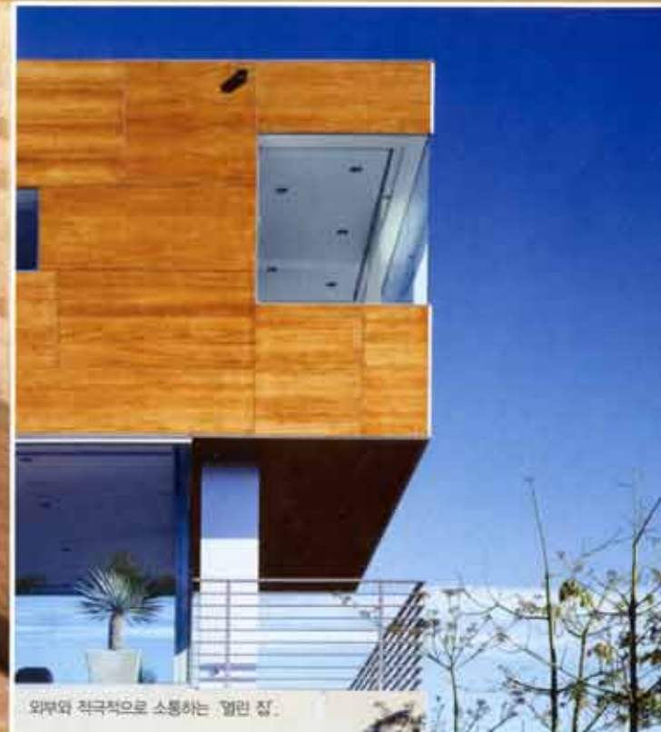
외부와 적극적으로 소통하는 열린 집.